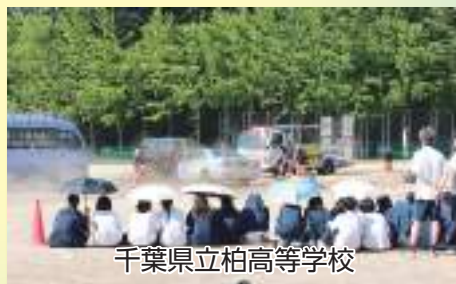
千葉県立柏高等学校