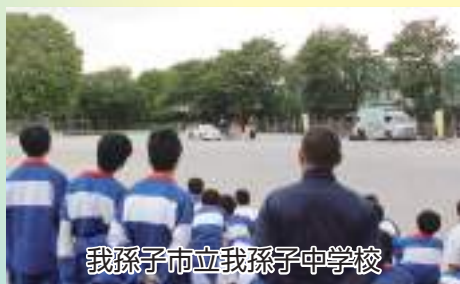
我孫子市立我孫子中学校

千葉県は、全国で4番目に交通事故死者数が多い県（令和4年中）です。歩行者、自転車、自動車それぞれが思いやりをもってルールを守り、交通事故を防ぎましょう。