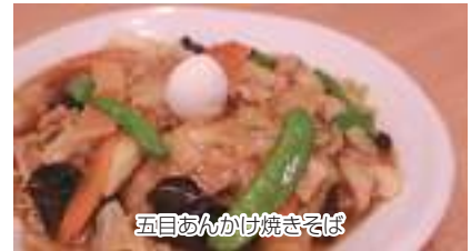
五目あんかけ焼きそば